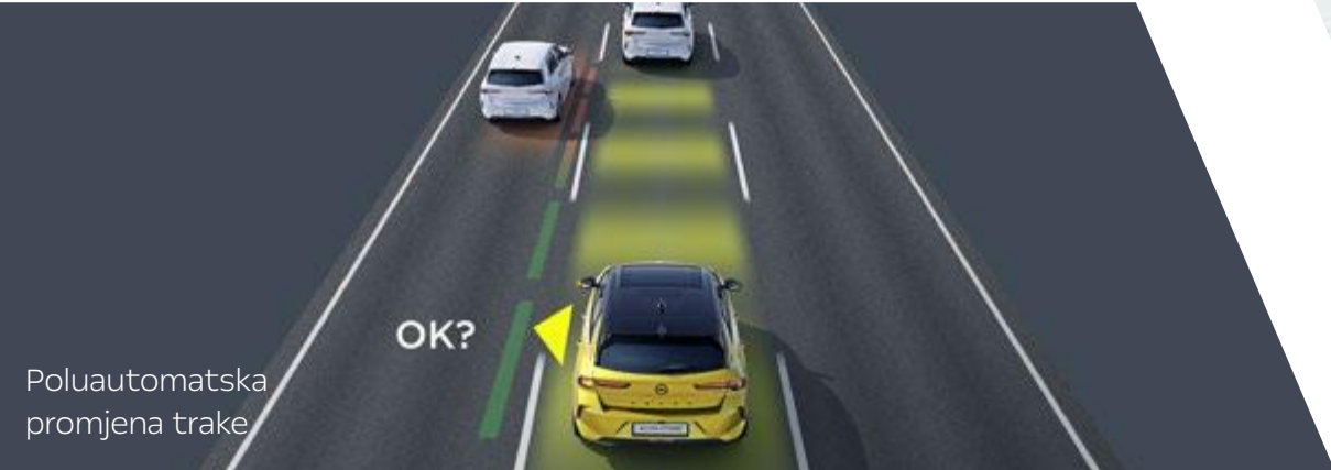
Poluautomatska promjena trake